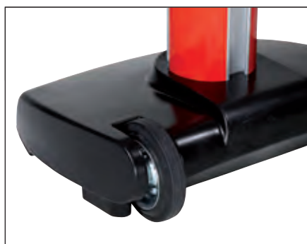
Dank der leicht laufenden Räder ist der JetTrac schnell und flexibel einsetzbar.